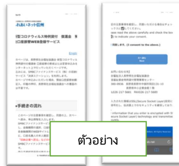
ตัวอย่าง