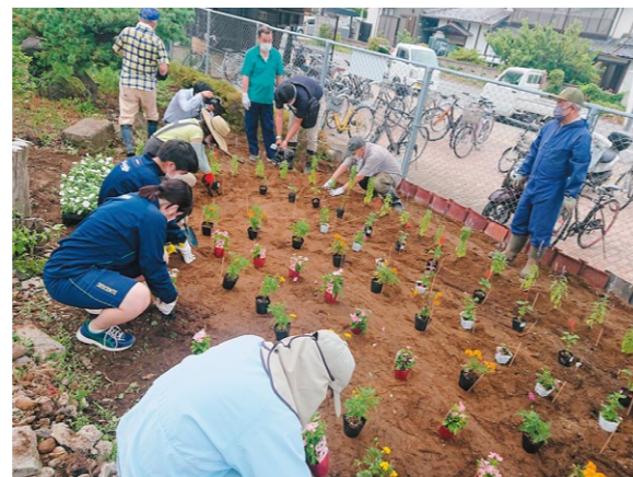
身よりのない当事者グループと地元高校生が協働して駅花壇整備活動

分配を通して、継続的な活動ができるよう団体の体制の強化や、新たな取組を応援することを通して、差別のない公平で誰一人取り残さない、自分が自分らしく最後まで健康にやりたいことができる社会を目指します。