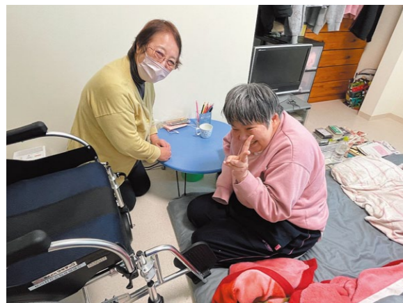
フォローを受けながら自分らしく暮らす

ご協力いただいた寄付は、意思の決定や権利行使の支援を行っている県内の社会福祉法人、NPO法人、一般・公益法人等の取り組みに分配します。