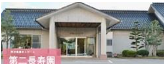
特養第二長寿園（同園ホームページから）

小木支所福祉避難所の活動も残すところ、1 週間ほど。今日は、歌謡曲や童謡を歌って、楽しい時間を過ごしています。「信濃の国」を披露したクールもあったとのこと。