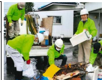
飯田ボランティア協会、穴水町