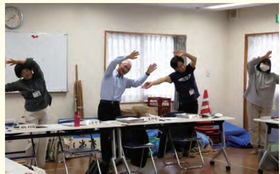
▲歌と体操を組み合わせた「おマメで体操」から始まる定例会

飯田市は「言葉遣いも柔らかく、気さくな気質の住みやすい町」と言います。その中でも橋北地区は「買物弱者の問題を抱える地区もある中、移動販売の業者が複数あり、隣近所の助け合いがしやすい市街地の当地区は、