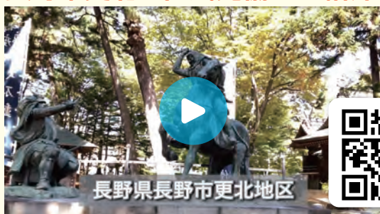
長野県長野市更北地区