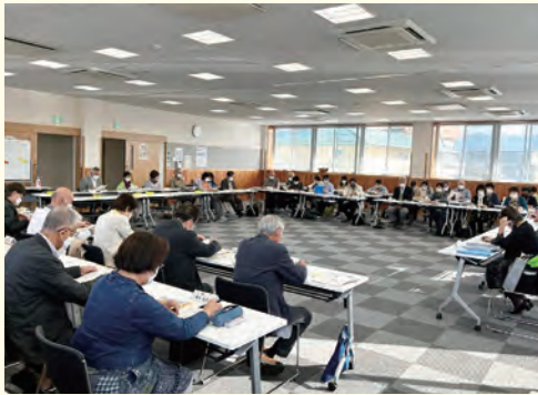
▲定例会：委員56人は長野市最大の規模

長野市最大、委員56人の大所帯です。人口3万4千人、高齢化率は市平均より約5%低い25.7%。1998年の長野オリンピックを機に広大な田畑が宅地や道路に変わり、若年層中心に人口が増えた活気あふれる地区です。