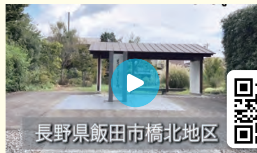
長野県飯田市橋北地区