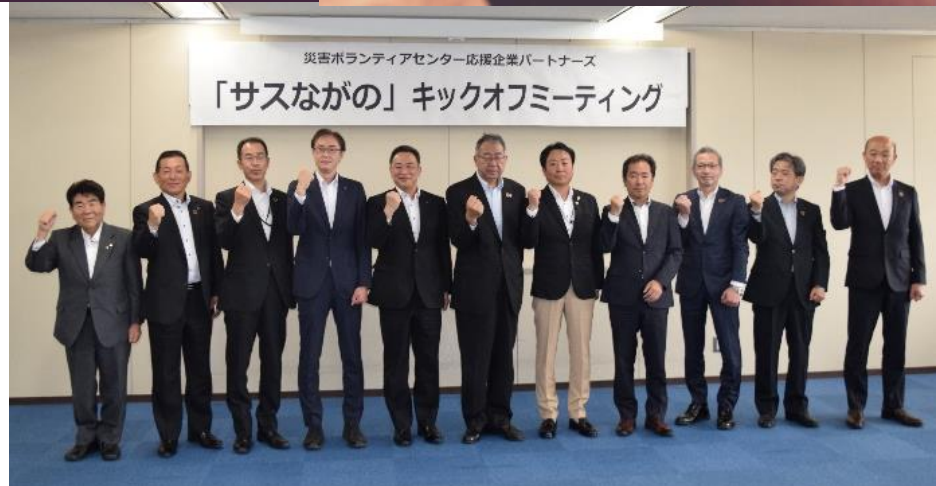
「サスながの」キックオフミーティング 令和5年5月25日(木)