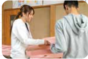
丁寧な関わり方には保育士の経験も生きている。

A 就労継続支援では、革製品の製造を利用者さんと行います。また、生活介護では、車椅子の方と個別作業をしたり、入浴等の介助をしています。一人ひとり状況が異なるので、その人に寄り添った支援を心掛けています。