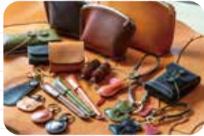
どれも手になじみ長く使える。新製品の開発にも余念がない。