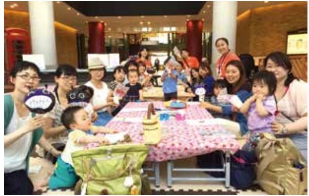
ママサポ主催の地域交流会の様子

「子育てシェア」では、顔見知りの登録者同士がつながり、困ったときに託児や送迎をスマホアプリをつかってお願いします。もちろん万が一の保険も完備されています。