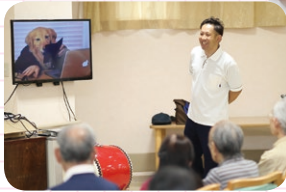
マンネリ化しないよう、毎日いくつかのレクを考えています。