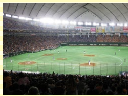
プロ野球観戦ツアー