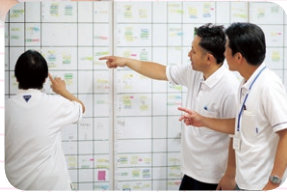
より良いサービス提供には綿密な打ち合わせも欠かせません。