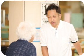
ご利用者様からの信頼も厚く、頼りにされています。