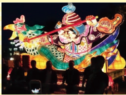
青森ねぶた祭の旅