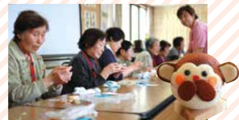
(医・福)心泉会 介護老人保健施設 ローズガーデン 〒390-0823 長野県松本市中山7494-8 TEL 0263-57-8002

福祉・介護サービスの提供だけでなく、地域とつながり、地域福祉を支えることを目指している事業所・法人の取り組みを紹介します。 (医・福)心泉会の地域「コミュニティ」「ローズカフェ」 「地域の未来を見据えた介護予防」 わたしたちのめざす地域貢献 vol. 02