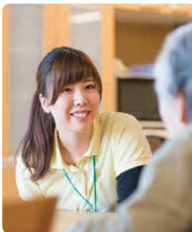
人生経験豊富な高齢者から励まされることも多いやりがいある仕事

常に人と関わるこの仕事は、相手とのコミュニケーションが不可欠です。そこで人と接するのが好きで思いやりがある人、相手の気持ちをくみ取り行動に移せる人が向いているのではないのでしょうか。大変な仕事ではありますが、私は日々、入居者さんから勉強をさせていただいています。「ありがとう」の言葉を聞くたびに、とてもやりがいを感じます。