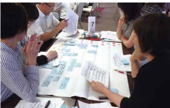
キャリアマネージャー養成研修の様子

このキャリアパスモデルに基づき、長野県社会福祉協議会では、長野県から委託を受けて平成24年度から福祉職員生涯研修を実施し、キャリアパスの構築を支援してきたところです。