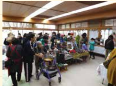
上：ママは制作中。赤ちゃんは別のママが抱っこ。 下：作品販売会はいつも地域の人たちで大賑わい です。

団体名/オシャレ手芸部(安曇野市 三郷地区) 問合せ先/安曇野市社会福祉協議会三郷支所 (TEL 0263-77-8080)