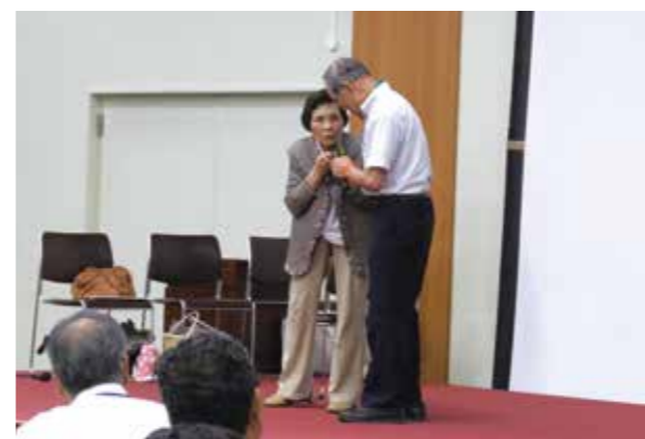
寸劇で認知症の役を熱演