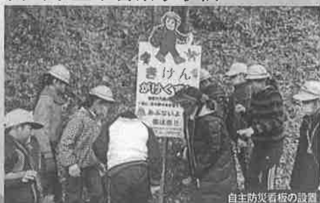
自主防災看板の設置

地域を守るのはほくらだ！ ～学校・地域・関係機関が連携した防災活動～ 岡崎市は、愛知県より、658か所が「土砂災害特別警戒区域」に指定されています(平成29年10月27日現在)。本校学区は、その内85か所あり、土砂災害の危険が高くなっています。その中、「岡崎市立常磐東小学校」では平成25年度から、小学校5年または6年生が中心となって総合的な学習の時間に、学校・地域・関係諸機関との連携をした防災学習を実施しています。