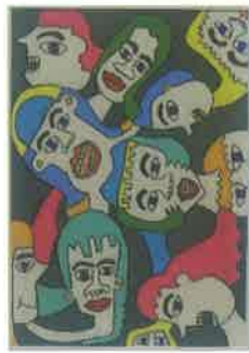
絵画 上條 美香