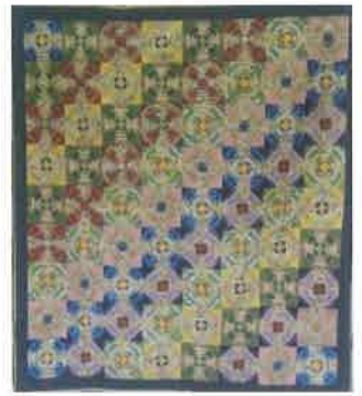
手芸 田中 賀代