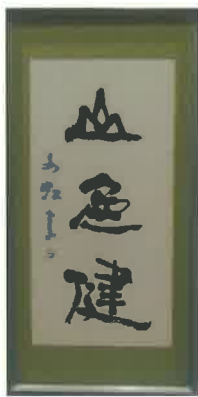
書道 都々地尾 孝喜