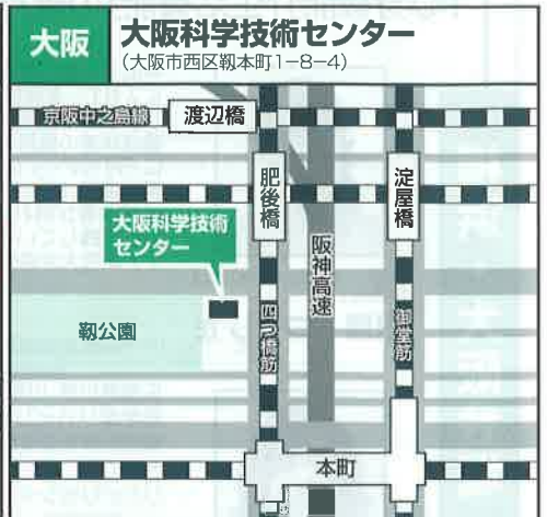
地下鉄四つ橋線「本町駅」より徒歩3分