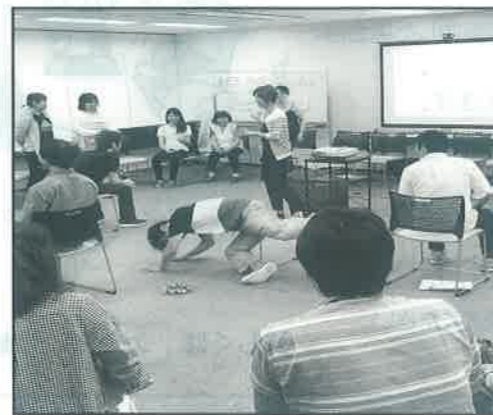
【講師】ケアレクインストラクター (NPO法人日本介護福祉教育研修機構認定)