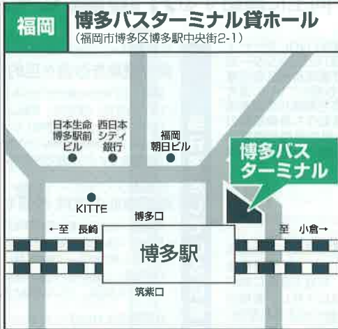
JR博多駅(博多口)から徒歩1分