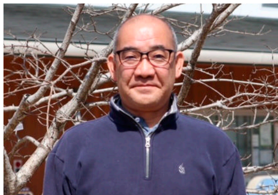
社会福祉法人 清水福祉会(千葉)理事 「清水こども園」園長