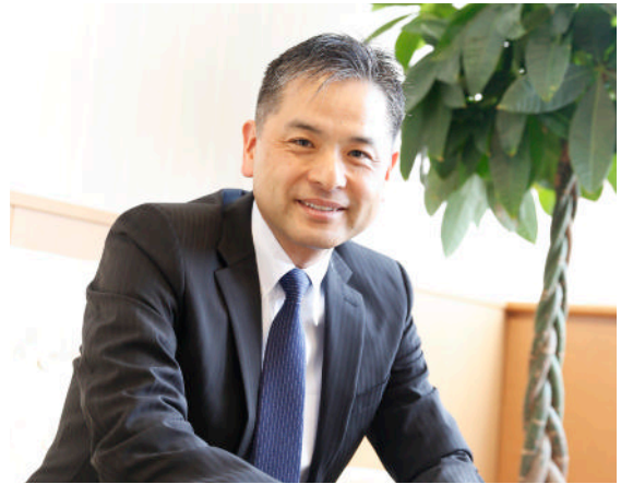
社会福祉法人 白川園(熊本) 理事長

経営者って結構孤独です。誰にも相談できない問題に直面した時、経営協のセミナーやイベントで知り合った仲間に連絡して話が聞けるのはありがたいです。他にも、WEB経営診断などの支援ツールが日頃の経営に役立っています。監査の解釈に疑問を感じたときは経営協の相談窓口で電話やメールで聞けるので助かっています。