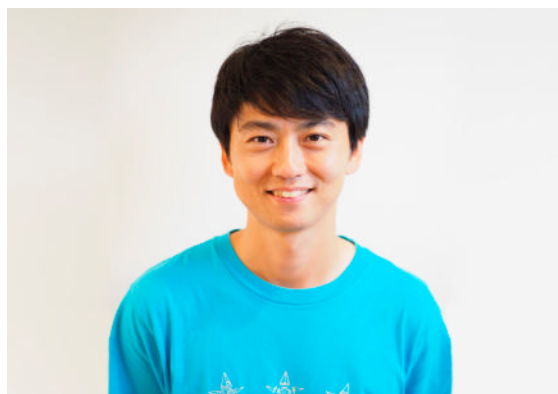
社会福祉法人 あさがお福祉会(徳島) 「みつぼしこどもえん」園長