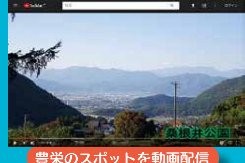
豊栄のスポットを動画配信