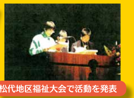
松代地区福祉大会で活動を発表