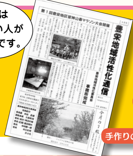
手作りの通信も発行