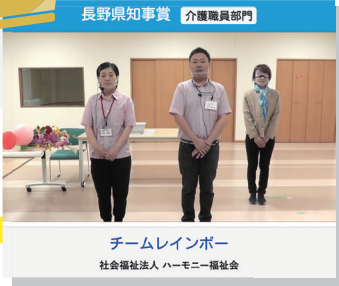
チームレインボー 社会福祉法人 ハーモニー福祉会