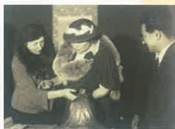
▲保己一の小さな像に親しげに触れているヘレン・ケラー

世界的偉人として讃えられる、目も見えず、耳も聞こえず、そのために話すことも困難であった女性、ヘレン・ケラーは、昭和12年(1937年)、埼玉会館で開かれた講演会でこのように話しています。