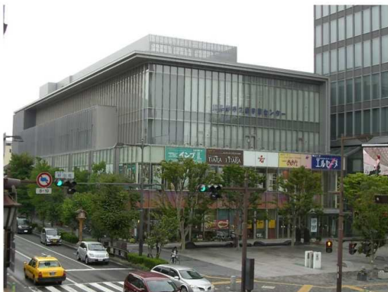
生涯学習センター(3・4 階)