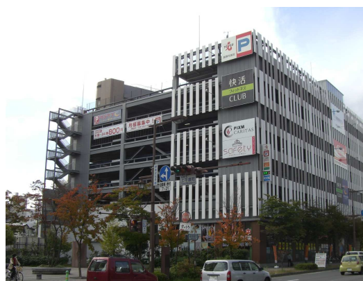
トイゴパーキング