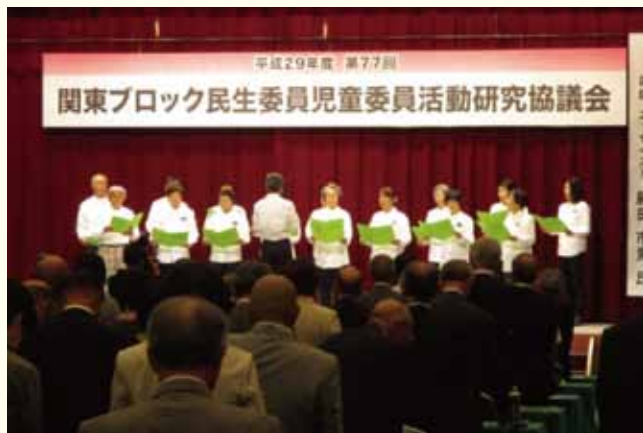
▲民生委員の歌「花咲く郷土」斉唱