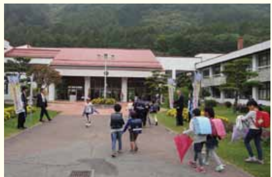
▲木祖小学校の前でのあいさつ運動の様子

独居の高齢者の見守りは、とにかく聞き役に徹することをモットーとしています。小さな村だけに、もともと知っている人も多く、その人の状況や村外にいる子どもの連絡先も把握。そして、会長は村内の老人ホームの第三者委員会にも所属し、情報収集に余念がありません。 定例会では、役場の担当職員、社会福祉協議会、保健福祉事務所、包括支援センターのケアマネージャーも出席します。司会は委員が持ち回りで、研修や活動の報告だけでなく、見守り対象者の名前や具体的な状況もその場で報告し合うようにしています。最近では認知症の問題が多く報告されるようになったとのこと。問題を整理し、「それは役場の職員が来週訪問します」「それについては社協でも把握し注意しています」など、解決方法を出し、対処。「一人で心配せず、みんなで把握して風通しの良い体制を」と地域の絆を大事にした活動は続きます。