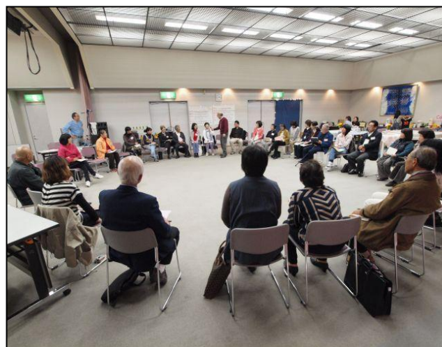
コーディネート力養成講座