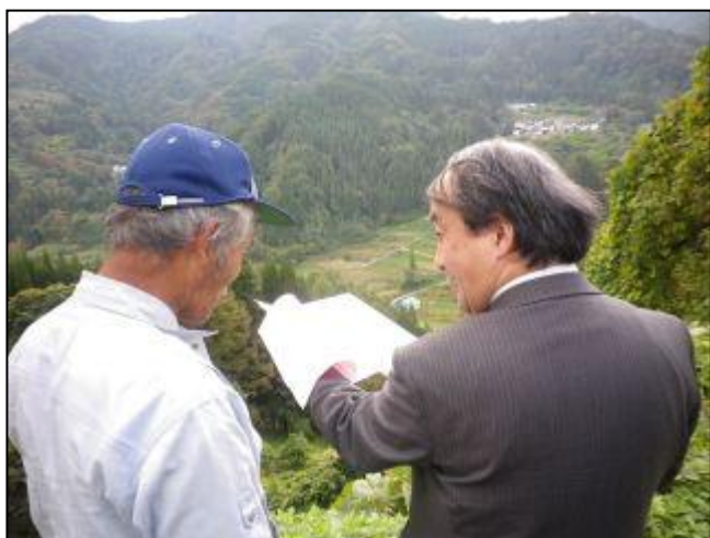
現場へ出かけてコミュニティソーシャルワーク講座