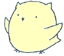
いきいきボランティア通信 キャラクター「いっくびく」